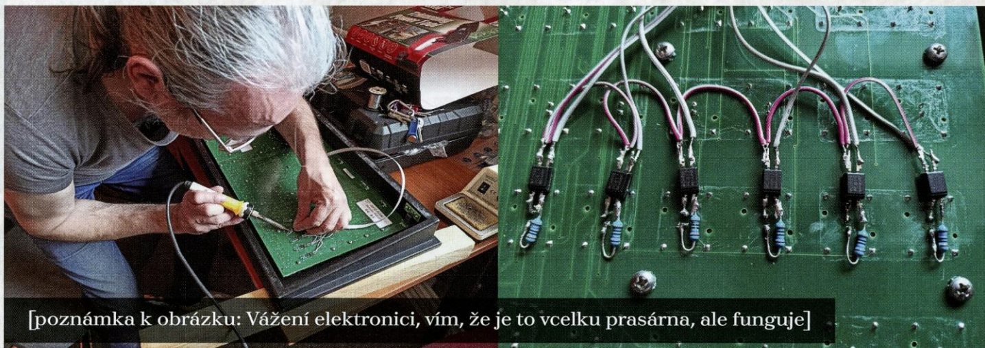
[poznámka k obrázku: Vážení elektronici, vím, že je to vcelku prasárna, ale funguje]

S tím Tricasterem jsem se seznámil hned ten první den, kdy jsem pomáhal stěhovat techniku zpět do skladu po ukončení koncertu. Futrál měl opravdu chabý, hadrový, s hadrovým uchem, a to zařízení váží málem víc, než já. Potrestal jsem ho: Dovolil jsem tomu uchu, aby povolilo. Brečelo, bylo mi ho líto. A tak si milý Tricaster rozbil hubu. Upadl. No nic, fungoval ještě několik let, než se zjistilo, že má důchodový věk a stěhoval se.