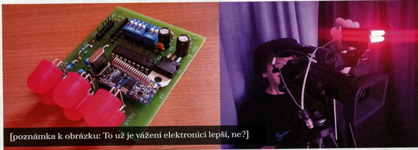
[poznámka k obrázku: To už je vážení elektronici lepší, ne?]